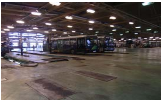
『BKV 社バス工場を視察』