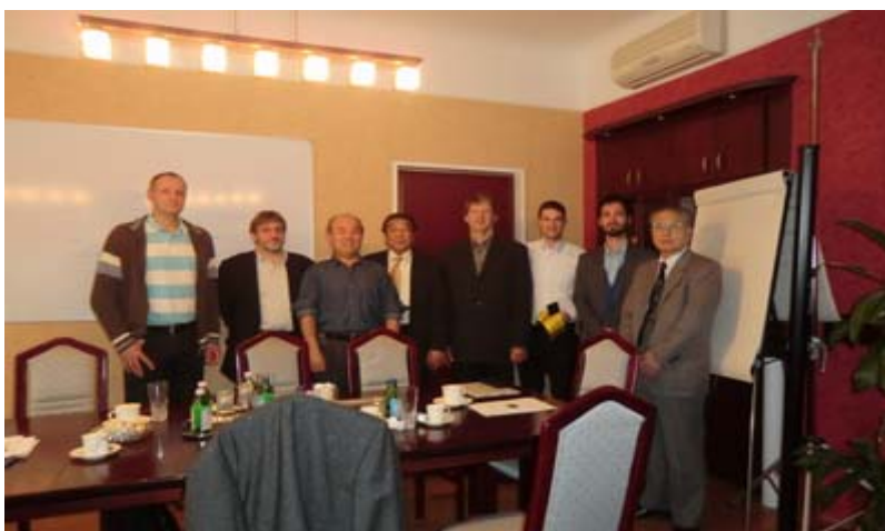
『BKV 社会議室にて撮影』

その結果、ハンガリーブダペスト国営バス(BKV社 http://bkv.hu/en/ )において当社、エコサポーターの実証プロジェクトを実施することが国家発展省-気候変動対策局のジョセフ局長より決定され、BKV本社で打ち合わせを行いました。